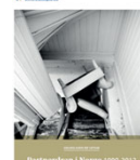
Partnerdrap i Norge 1990-2017 www.sifer.no

Regjeringen har i dag nedsatt et utvalg som skal gjennomgå saker med drap der gjerningspersonen er daværende eller tidligere partner. Hensikten er å avdekke om, i hvilken grad og eventuelt på hvilken måte det har forekommet svikt i det offentlige tjenesteapparatets håndtering i forkant av disse sakene. Utvalget skal gi anbefalinger som kan bidra til at fremtidige tilfeller forebygges og forhindres.