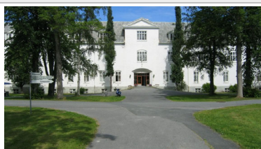
Utvalg: Menn som henvises til sinnemestring i Trondheim og deres partnere/ekspartnere